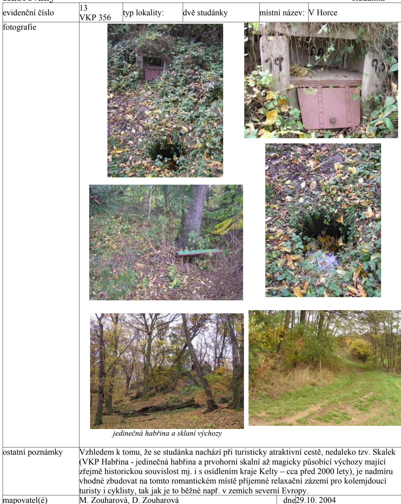
jedinečná habřina a sklaní výchozy